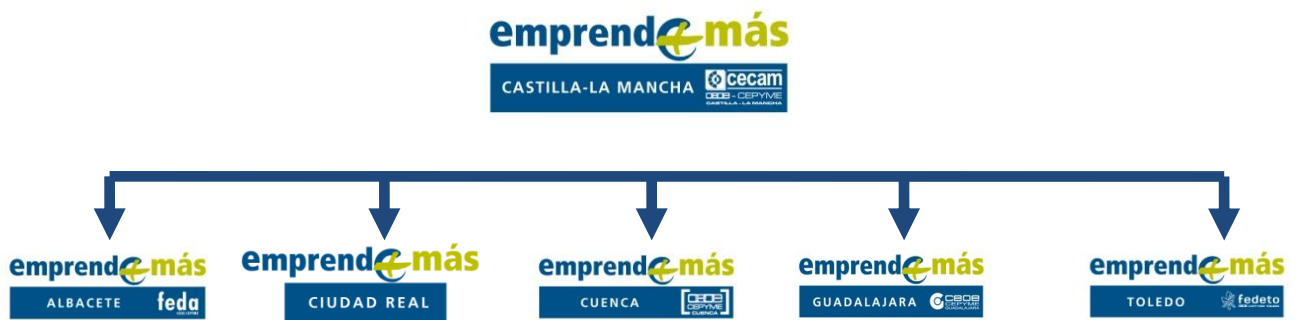
Gráfico 1: Organización técnicos Emprende+más de CECAM

Señalar que uno de los máximos esfuerzos realizados por nuestra Organización Empresarial, ha sido la descentralización de las actuaciones relacionadas con Emprende+más de las capitales de provincias , acercándonos a través de los técnicos de CECAM al máximo número de localidades. Asimismo, nuestra estructura nos ha permitido asesorar e informar a un gran número de interesados, como se muestra en el Gráfico 1.