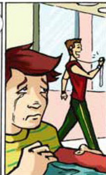
Al día siguiente.